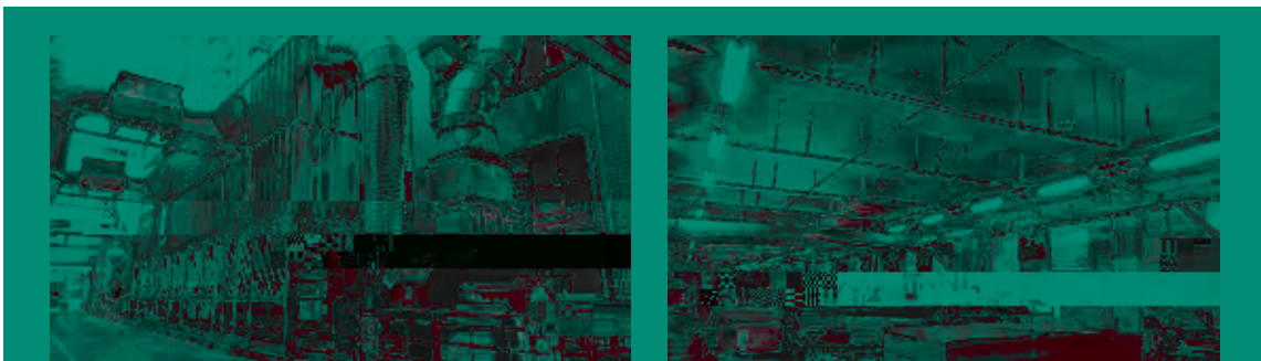
木工車間粉塵處理裝置1

在木工車間，本集團於中國所有製造基地使用了新型除塵設備，以有效降低粉塵的濃度，減少廢氣的排放，保護了從業人員的健康。同時，板式傢具廠廢水經過處理後可以在生產線上循環使用以節約水資源。通過建立密閉式噴塗裝置，使有害氣體不會外漏以保障員工安全的工作環境。(請參閱下圖)