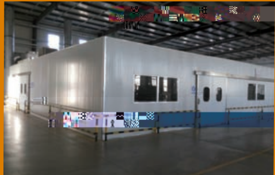
設備密閉式噴塗裝置