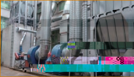
木工車間粉塵處理裝置

在木工車間，本集團於中國所有製造基地使用了新型除塵設備，以有效降低粉塵的濃度，減少廢氣的排放，保護了從業人員的健康。同時，板式傢具廠廢水經過處理後可以在生產線上循環使用以節約水資源。通過建立密閉式噴塗裝置，使有害氣體不會外漏以保障員工安全的工作環境。（請參閱下圖）